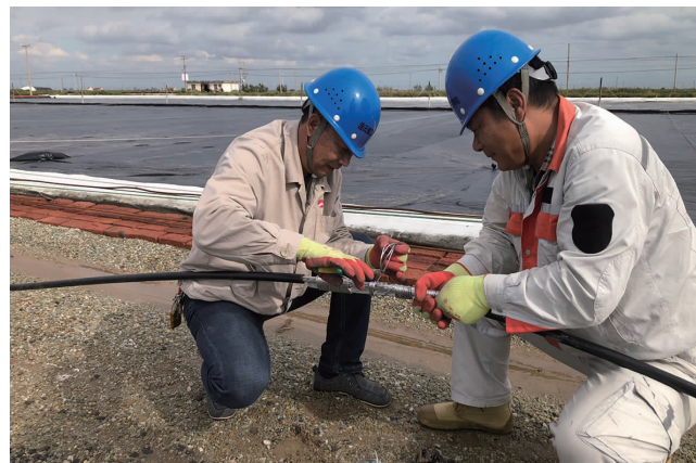
秋季扒盐以来,灌西供电所切实加强电网维护,落实好24小时值班制度,对涉及扒盐的垮新线、二新线、柴路等3条10KV线路进行拉网式检修,加大巡视力度。处理2台变压器缺相故障,及时更换2只漏电保护器和120米10KV线路,全力以赴保证秋扒进行。(武文)

深入打好资源挖潜牌。谋划举措,理清资源,摸清承租商户,变租为用,改变以租为主状态。同时努力学习市场知识,提高资源开发能力,将资源牌打好打响。(北宣)