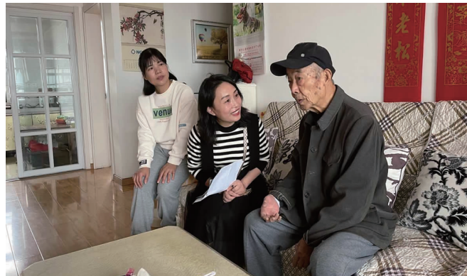
重阳节飘着细雨,天气渐入深秋。台北猴嘴办事处在重阳节之际,登门拜访离退休老干部,为他们带去节日的祝福,并送上体检卡。(毛艾青)