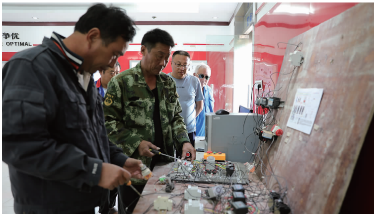
10月14日,徐圩投资公司生产技能培训基地第二期正式开班,该基地通过内部培训和外请老师的方式,围绕车床、配电、电焊、机械修理、设备安装等技能进行理论与实操培训,采取“一对一”技能帮扶形式,为企业转型发展储备综合性技术人才。(胡立志)

管理助力发展和谐。狠抓内控管理,规范账务管理,加大债权清欠力度,压缩各项费用支出得到有效落实。“大干下半年,奋力冲刺全年目标”系列劳动竞赛活动深入开展,有力推动了各项工作进程。严格执行“两会一公开”制度,强化民主管理,严格把好工程项目的招投标、预决算、验收审计等程序监督关。深入开展“金秋助学”“阳光救助”等扶贫帮困活动,关爱弱势群体,确保公司在稳定中高质量发展。(靳静)