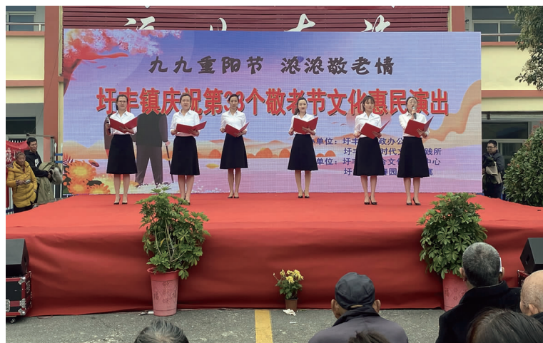
10 月 14 日下午,徐圩投资公司团委在圩丰镇养老服务中心开展“九九重阳节,浓浓敬老情”慰问活动。志愿者们为老人们表演了朗诵《我是中国人》、小品《宝钟》等丰富多彩的节目,文艺节目表演过后,全体志愿者通过帮老人打扫卫生、和老人聊天等方式向老人们致以节日的祝贺和问候,并送去慰问品。(戴月婷)